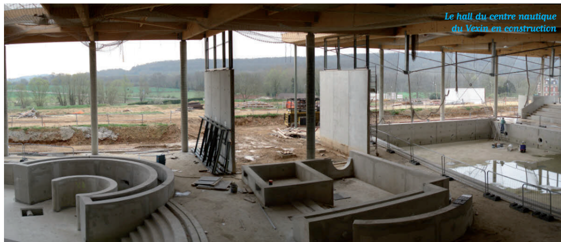
Le hall du centre nautique du Vexin en construction