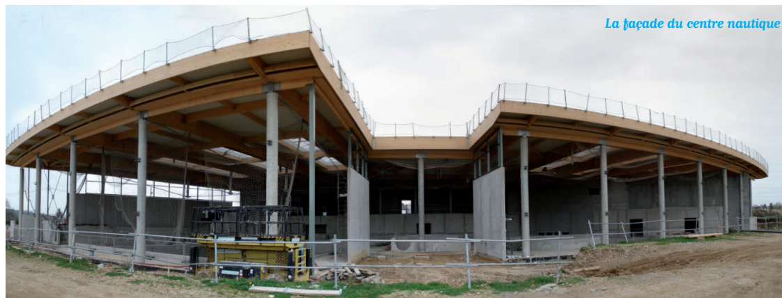
La façade du centre nautique

l'amortissement de l'investissement, le centre nautique ne devrait coûter à la Communauté de communes qu'entre 385 000 et 400 000 euros par an, soit une économie de 25 % par rapport aux estimations initiales. Rappelons que le centre comportera un bassin de 300 m 2 comprenant six lignes d'eau, un bassin d'apprentissage de 160 m 2 ainsi qu'un spa, un sauna, un hammam, un jacuzzi, une rivière à contre-courant et un toboggan.