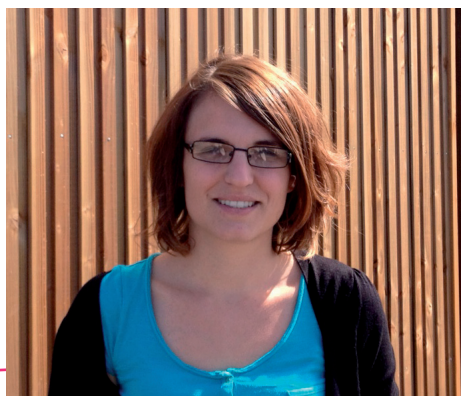
Lettre de la Communauté de communes Gisors-Epte-Lévrière

puis à la crèche « Boule de gomme ». En poste à Capucine dès le mois de mai, elle a participé à la préparation d'un projet d'établissement qui fait la part belle à l'éveil, à la socialisation et à l'autonomie du jeune enfant. Si la halte-garderie et la crèche collective ont un régime d'inscriptions différencié, il n'en est rien dans le fonctionnement quotidien : « Les enfants sont ensemble dans la journée, avec les mêmes auxiliaires de puériculture et les mêmes activités », tient-elle à préciser. Le multi-accueil fonctionnera à plein à partir de janvier. À noter qu'il reste encore des places pour l'accueil en halte-garderie.