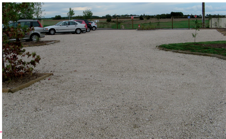
Lettre de la Communauté de communes Gisors-Epte-Lévrière