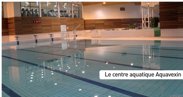
Le centre aquatique Aquavexin

• la réhabilitation des installations d'assainissement non collectif qui permettra à terme d'améliorer la qualité des rejets.