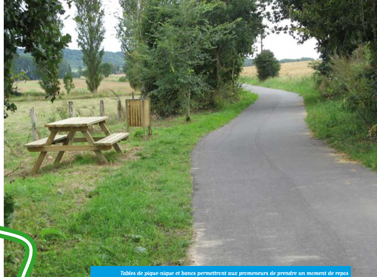
Tables de pique-nique et bancs permettront aux promeneurs de prendre un moment de repos en famille et d'apprécier la campagne environnante.

marché artisanal qui proposera des produits locaux du terroir, des animations pour les enfants (structure gonflable) et un point de restauration. De la salle des fêtes partira également une randonnée pour la journée organisée par le club rando de Gisors.