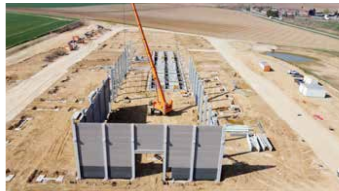
Le nouveau site du groupe Depestele en construction, visible depuis la D148 au rond-point de Saussay-la-Campagne et Frenelles-en-Vexin.

G roupe international d'origine belge ancré depuis longtemps en Normandie - et plus précisément en Seine-Maritime, à Valmartin et à Bourguébus - Depestele est le premier producteur de lin privé en Europe . Il gère toute la filière textile, de la culture du lin à la production de tissus ennoblis.