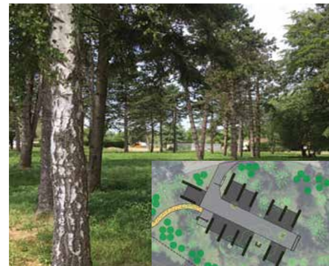
L'aire est implantée dans un cadre boisé particulièrement remarquable.

Pierre Durand) l'aire sera ouverte 24h/24 au tarif de 10 € par camping-car et par jour, tous services compris (hors taxe de séjour). Sauf contrainte de chantier, elle devrait être opérationnelle dès la fin juin 2022.