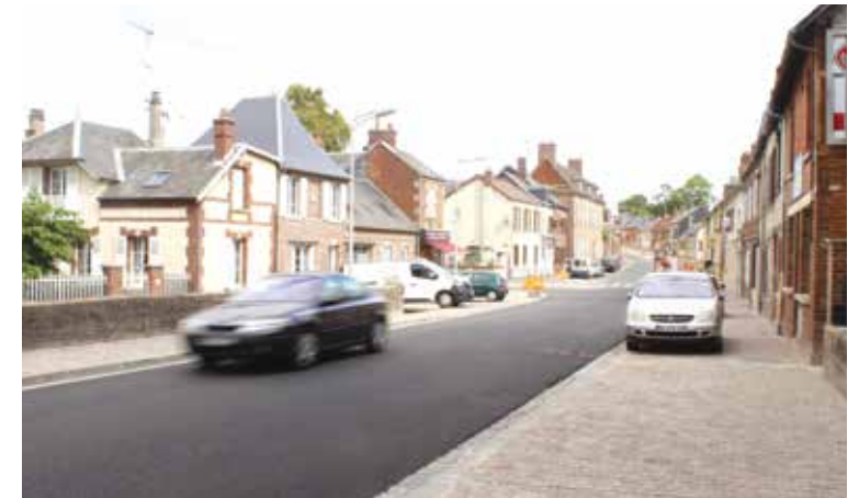
En aidant les habitants à valoriser leur patrimoine, la Ville valorise également le sien.

Le montant de la prime est fixé à 20 % du coût global TTC des travaux de ravalement, avec un plafond de dépense de 10 000 € TTC (soit 2 000 € par immeuble, dans la limite des crédits votés par le Conseil Municipal).