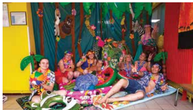
Créer des ambiances, faire voyager et découvrir aux enfants et aux jeunes des horizons et des activités nouvelles, c'est aussi cela la mission des équipes d'animation

Les inscriptions pour les vacances d'été 2022, ouvertes depuis le dimanche 5 juin, se poursuivront jusqu'au vendredi 17 juin à l'accueil du Pôle Enfance Jeunesse et jusqu'au dimanche 19 juin sur le Portail Familles.