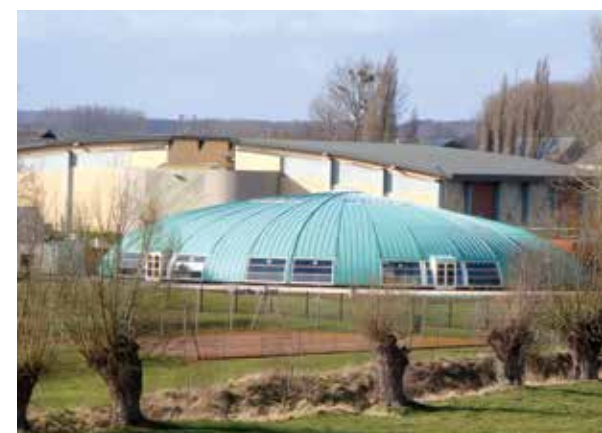
La piscine "tournesol" et le gymnase d'Étrépagny seront rénovés