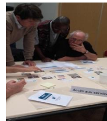
Ateliers de travail du Conseil de développement du Vexin Normand