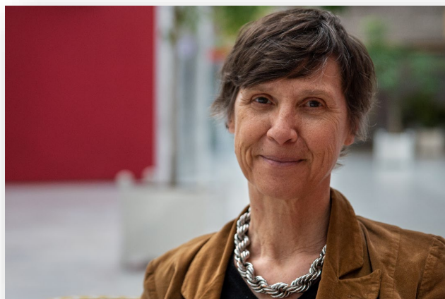
Présidente de la Communauté de communes du Vexin Normand