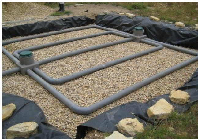
Système de traitement